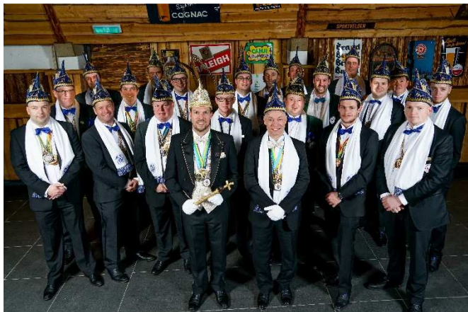
Prins, hofhouding en bestuur 2016-2017