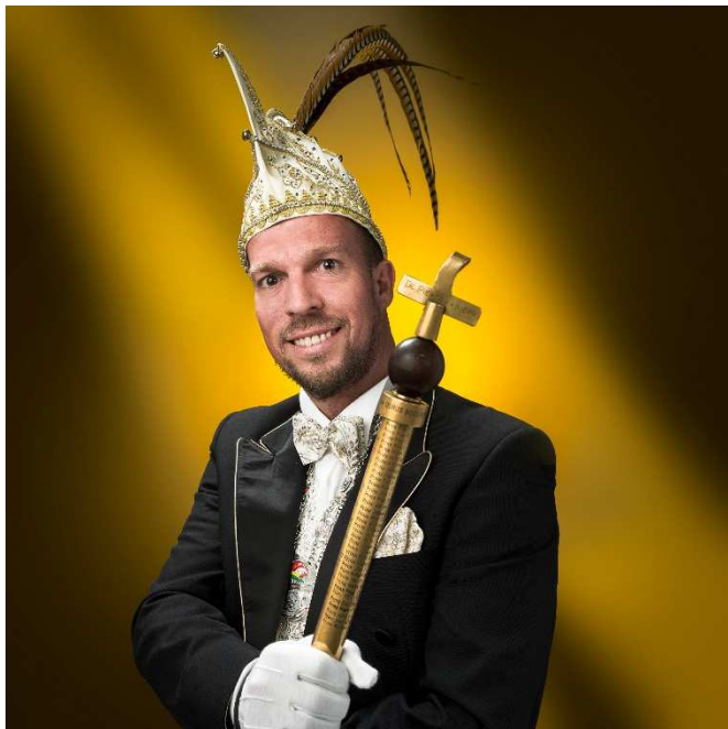
Prins Pier XXXXXV